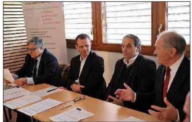
►► Cette association ambitieuse économiquement a été matérialisée hier par la signature de cette convention.