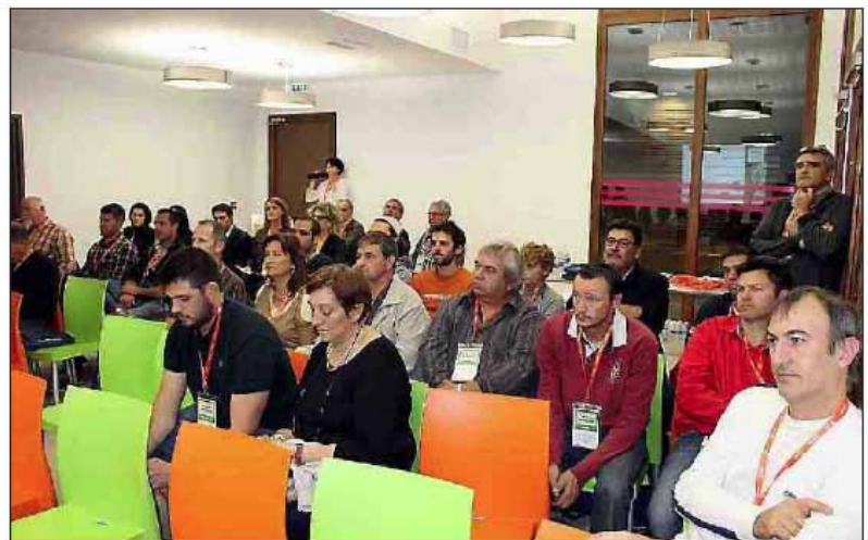
► Des chefs d'entreprises attentifs et très intéressés.

Les chefs d'entreprises invités provenaient de plusieurs secteurs d'activité : travaux publics ; climatisation ; peinture ; plomberie ; chaudronnerie ; serrurerie ; amiante ; nettoyage ; laboratoire ; auto-